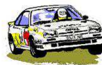
La Bresse AUTO SPORT